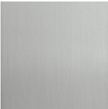
Aluminum eloxiert Silber