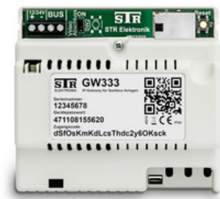
GW333 IP-Gateway Qwiksmart plus