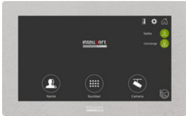
KIV-3 Intelliport Videostation