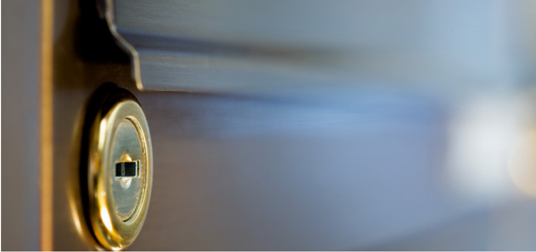
Beschläge und Metallhandwerk