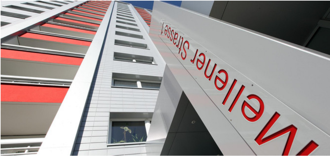
Bau- und Immobilienwirtschaft