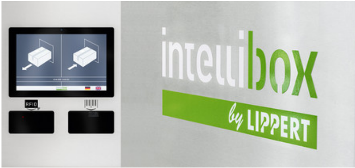
Paket- und Servicestationen