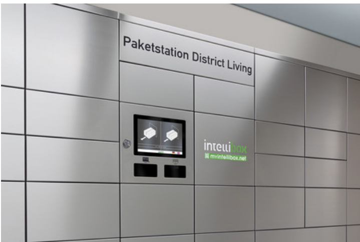
District Living Wien