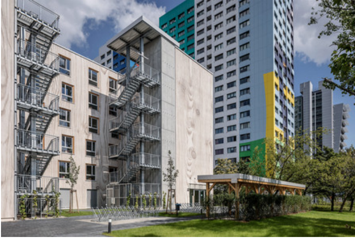
Stockower Straße 205