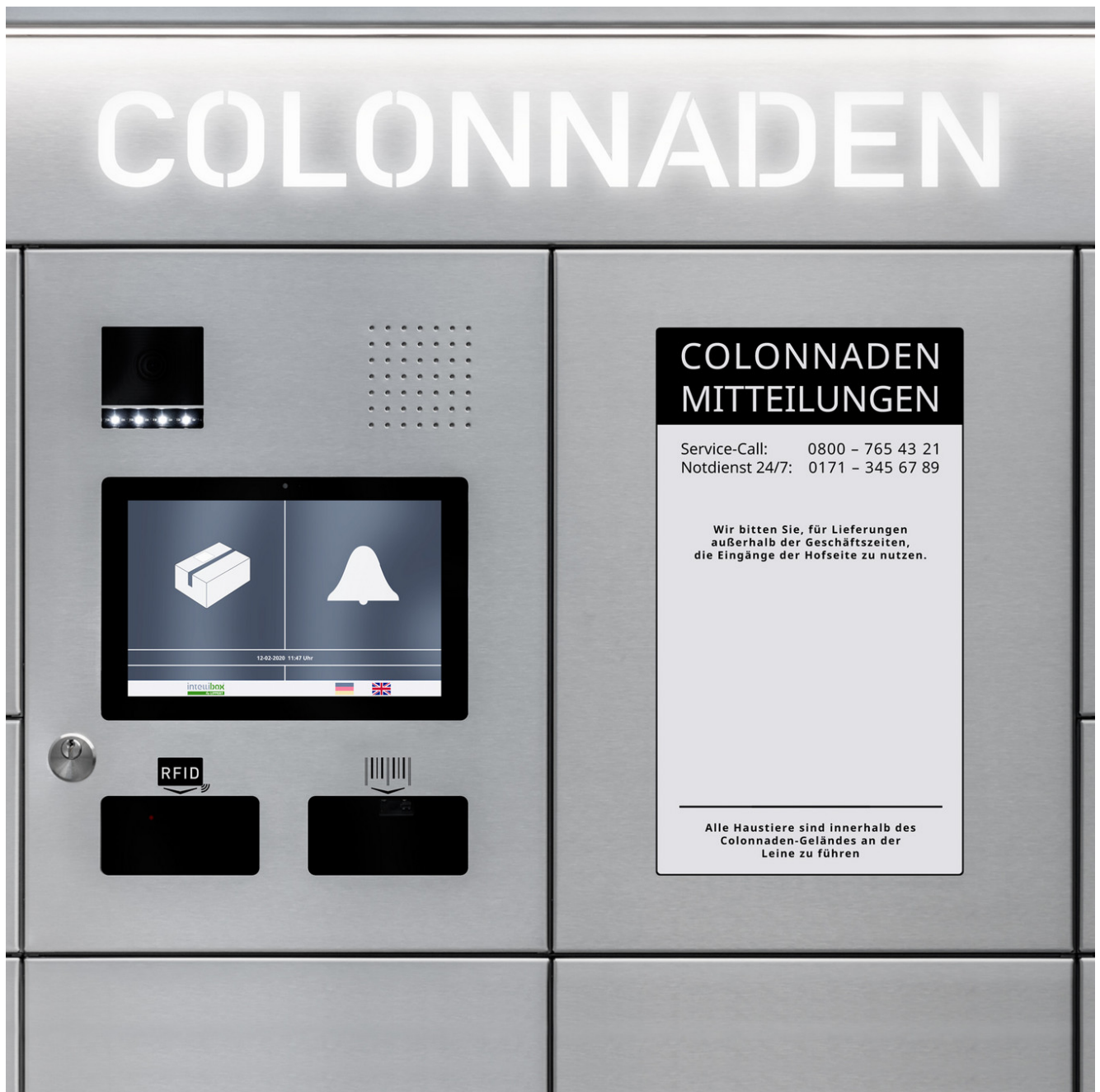
Intelliport Hub als zentral gesteuertes System