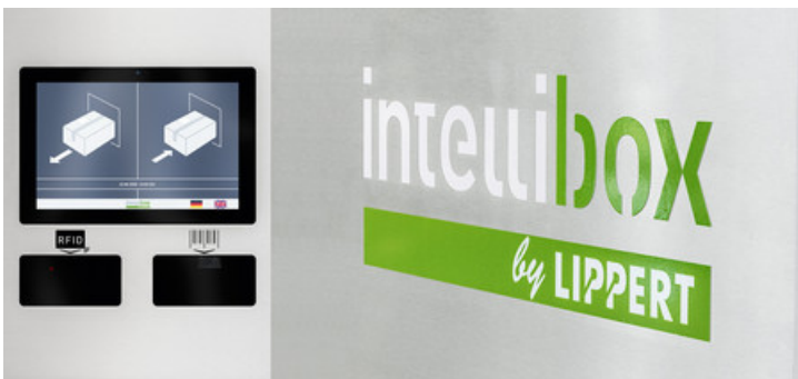
Paket- und Servicestationen