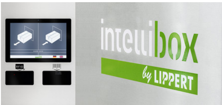
Paket- und Servicestationen