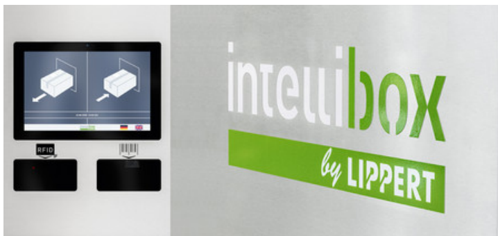
Paket- und Servicestationen