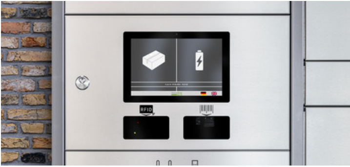
Servicestationen mit Ladefächern