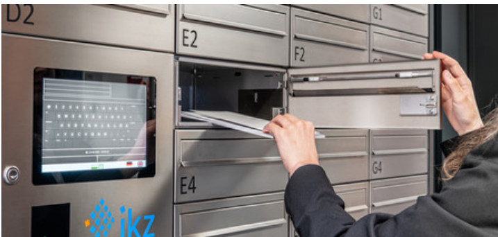
Servicestationen für Intralogistik