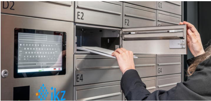
Servicestationen für Intralogistik