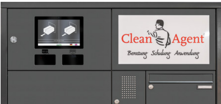
Servicestationen für Click & Collect