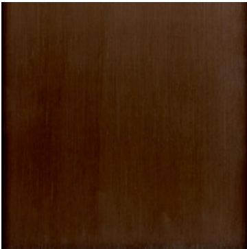
Material Aluminium eloxiert E6/C34 "dunkelbronze"