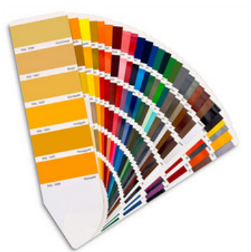
Grundmaterial pulverbeschichtet oder nasslackiert nach Farbkarte.