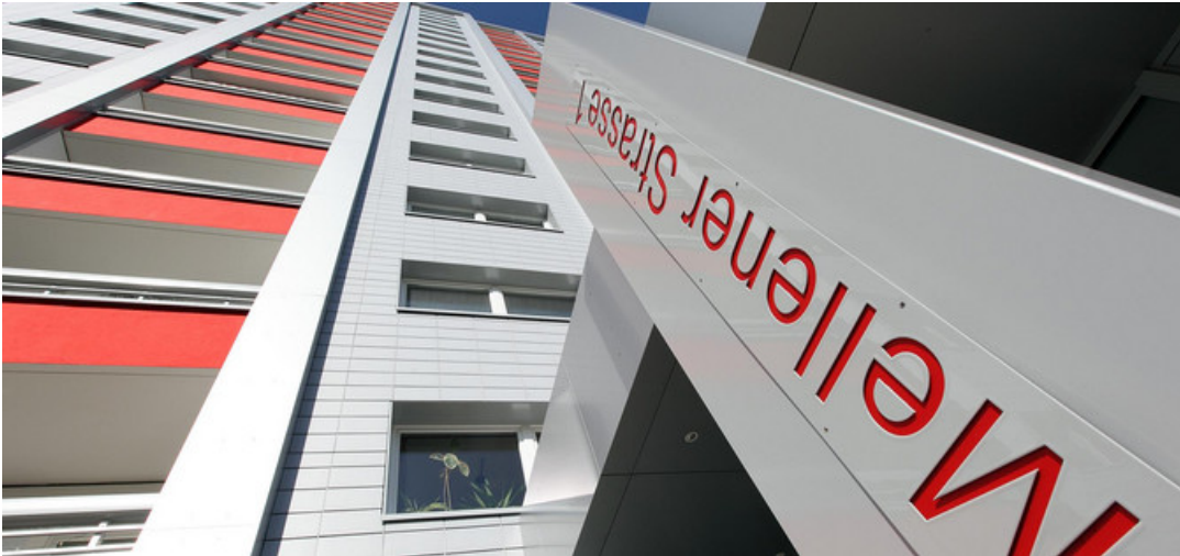
Bau- und Immobilienwirtschaft