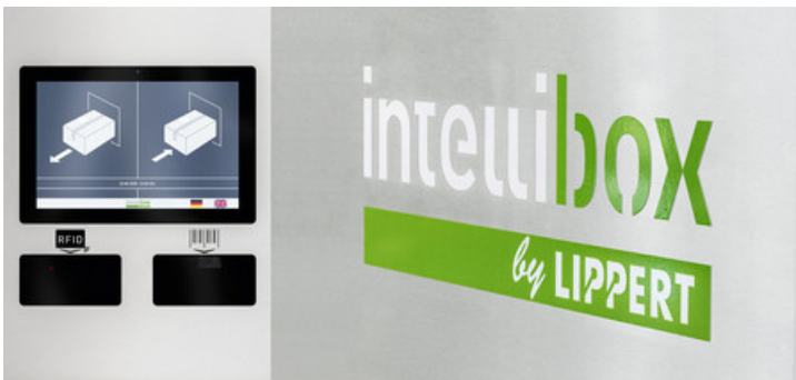
Paket- und Servicestationen